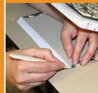
Arbeiten am Buchdeckel